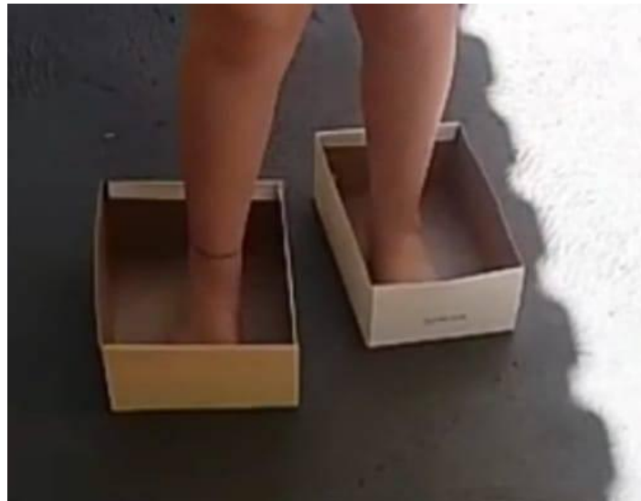
IMAGEM DE COMO SERÁ A ATIVIDADE:

Para brincarmos de patins engraçados vamos precisar de duas caixas de sapato. A criança vai andar usando as caixas de sapato, brincando de faz de conta, ou seja, vai colocar um pé dentro de cada caixa de sapato e arrastar ou deslizar pelo chão como se fosse patins. Pode ser feito uma linha de saída e uma linha de chegada para que a criança possa andar com os patins engraçados respeitando o limite.